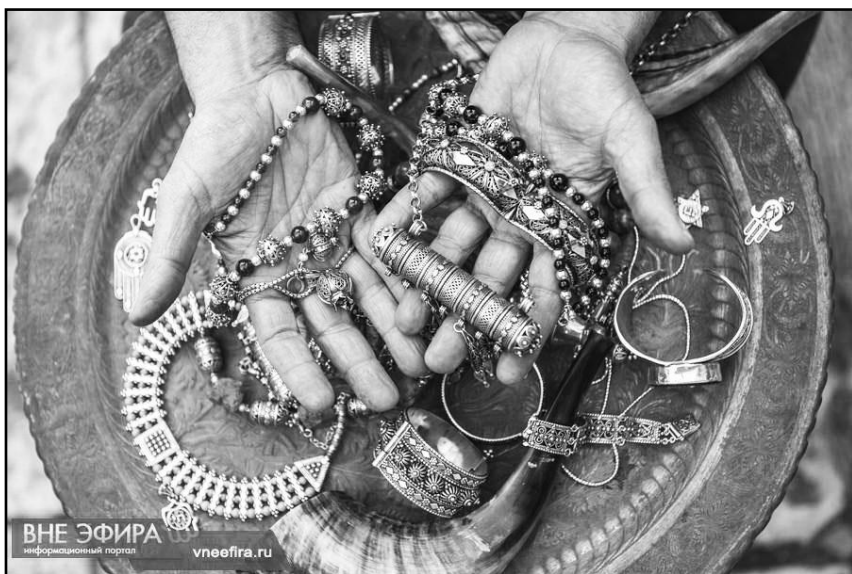
Рисунок 1. Израильские ювелирные украшения, выполненные в технике пяти нитей, которая существует уже более 2500 лет.

– ...Ничем они не рискуют! Такая «торговля» ничем не отличается от грабежа. У нас, помню, тоже было подобное: хулиганы, подкараулив в укромном месте какого-нибудь тихого интеллигента в очках, предлагали купить кирпич за 10 рублей (полтора литра водки). И наседали, и вымогали деньги. По закону, тоже не грабеж, а на самом деле самый что ни на есть циничный грабеж.