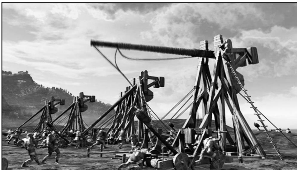
Рисунок 2. Древние катапульты (подобные метательные орудия использовали и Ассирийские завоеватели, и Вавилонские, и Римские при осаде городов).

в Верхнем городе, который был наиболее густо заселен. Большая же прочность строений храма и царского дворца пока что сохраняла их от разрушения в Халдейском адском пламени – пока.