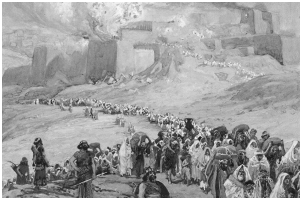
Рисунок 3. Джеймс Тиссо. Бегство пленников (евреев).